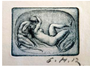
Kassette mit kleinen Läsuren, innen sauber.

Goethes unbekanntere erotische Epigramme. Mit Radierungen nach des Dichters Sammlung erotischer Gemmen von Carl Heinz Roon und einem Nachwort der Neuherausgeber. Verlag: Venedig, Privat-Druck für den Markuskreis, 1924. – Exemplar Nummer 7 (von XXX). 29,3 x 19,8 cm. Blaue Halbleinencassette, seitlich in Silber gefasst. Lose inliegend: 1 weißes Blatt, Titelblatt, 77 (1) Seiten, 1 weißes Blatt. Carl Heinz Roon radierte die Platten und druckte und signierte eigenhändig die Abzüge. € 700